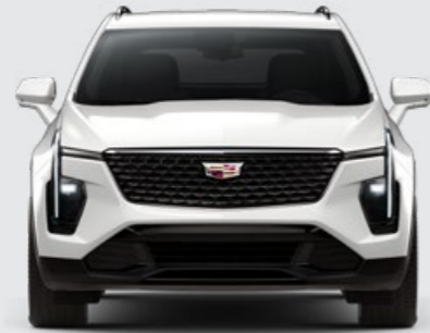
ABALONE WHITE TRICOAT