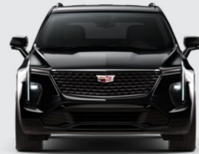
BLACK MEET KETTLE METALLIC