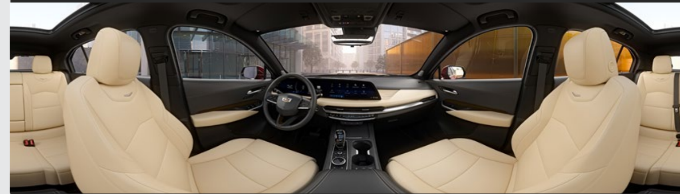
JET BLACK / OXFORD STONE DISPONIBLE EN VERSIÓN PREMIUM LUXURY