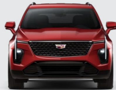
RADIANT RED TINT METALLIC