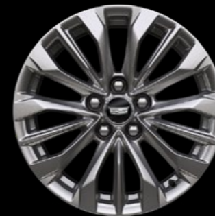
RINES DE ALUMINIO DE 18"