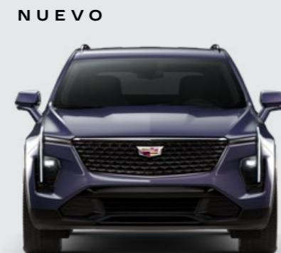
NIGHT SHADE METALLIC