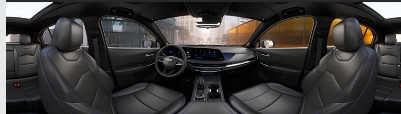
JET BLACK / SANTORINI DISPONIBLE EN VERSIÓN SPORT