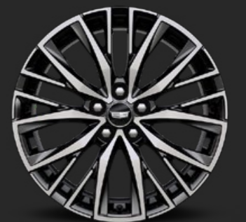
RINES DE ALUMINIO DE 20"