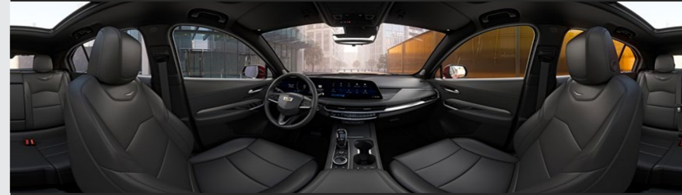
JET BLACK DISPONIBLE EN VERSIÓN PREMIUM LUXURY