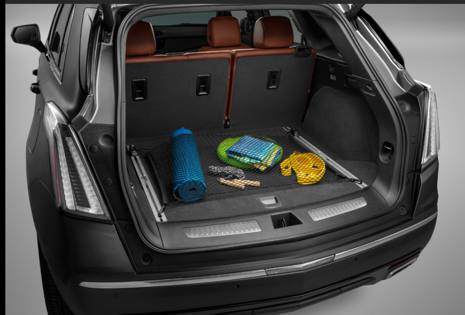
RED DE CARGA HORIZONTAL