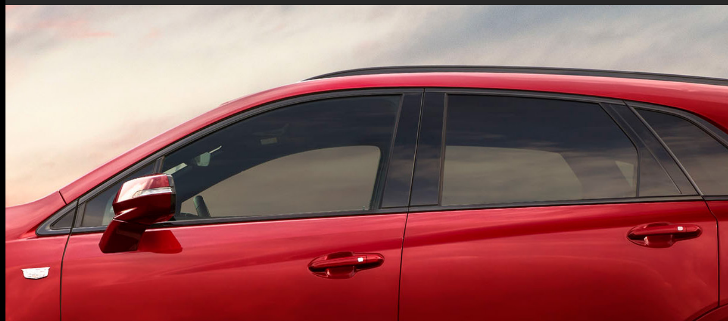
PELÍCULA DE SEGURIDAD Y CONTROL SOLAR