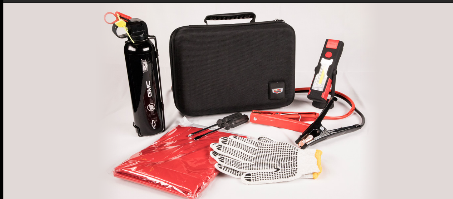
KIT DE EMERGENCIA BÁSICO