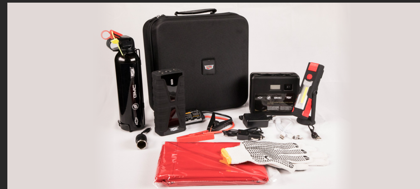
KIT DE EMERGENCIA PREMIUM