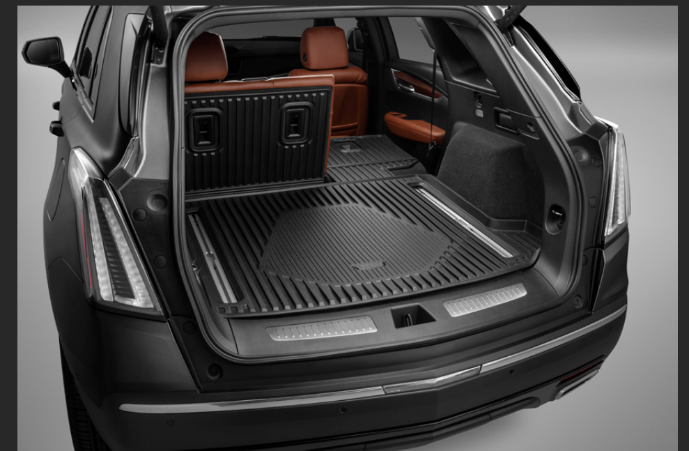
TAPETE DE VINIL RÍGIDO CON COBERTURA EXTENDIDA