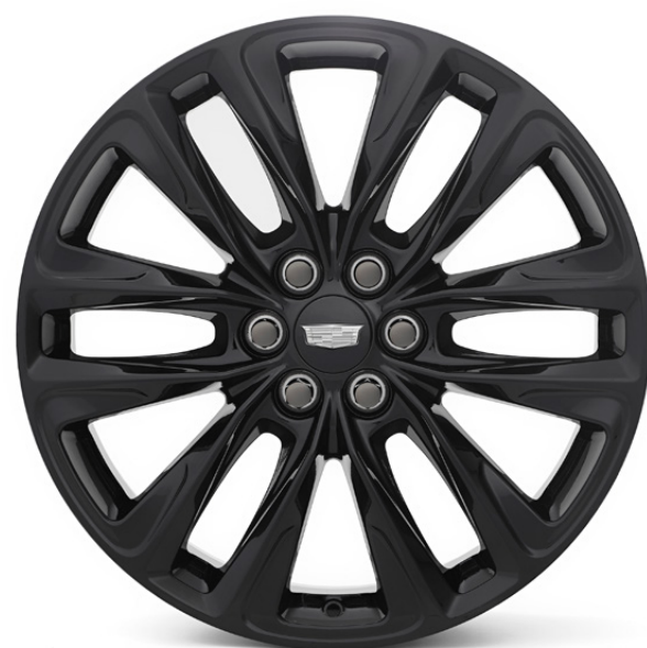
RIN DE 20" EN NEGRO BRILLANTE