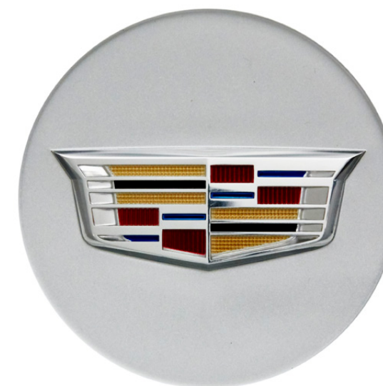
CENTRO DE RIN PLATEADO CON LOGO CADILLAC®