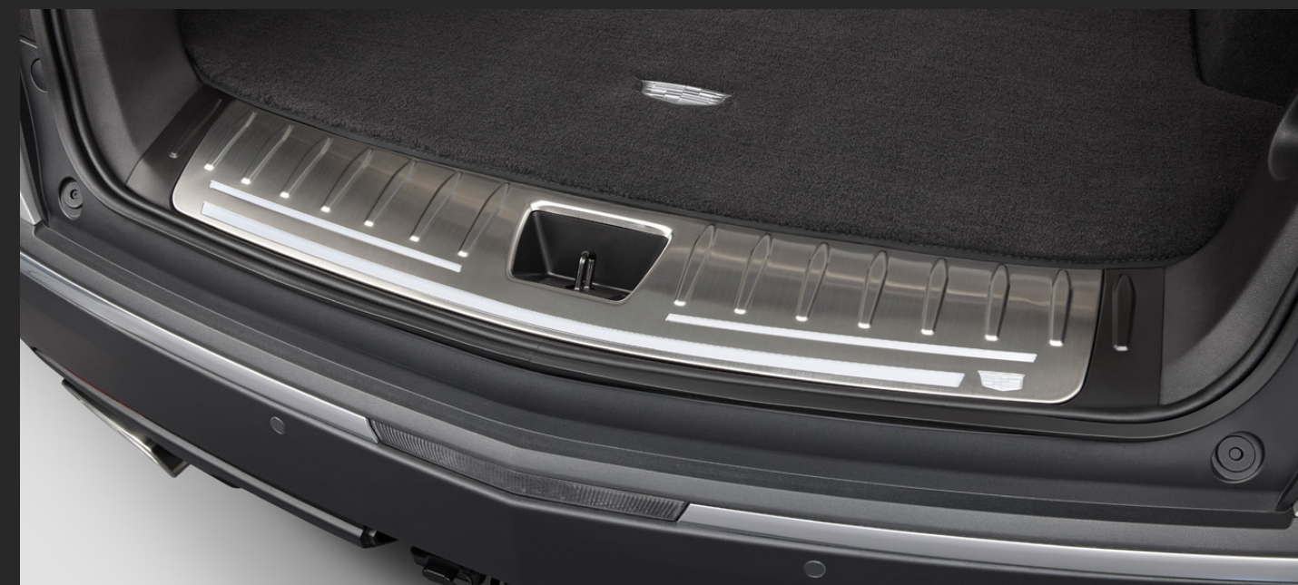
PROTECTOR DE CAJUELA ILUMINADO EN NEGRO