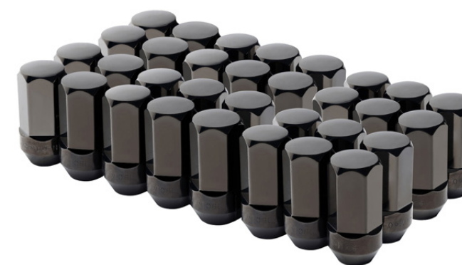
BIRLOS EN NEGRO (24 PIEZAS)