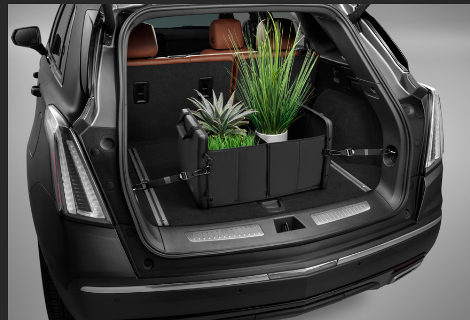
ORGANIZADOR DE CAJUELA EN NEGRO CON LOGO CADILLAC®