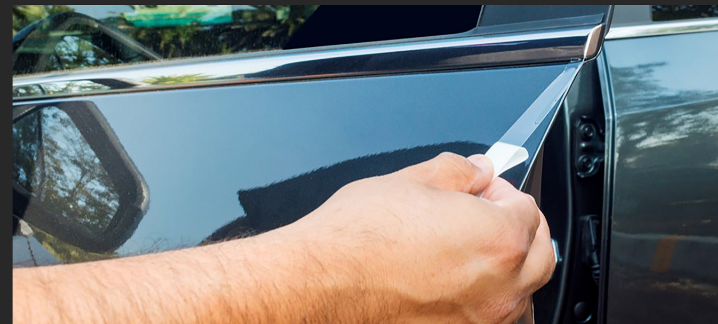
CINTA DE PROTECCIÓN DE PINTURA