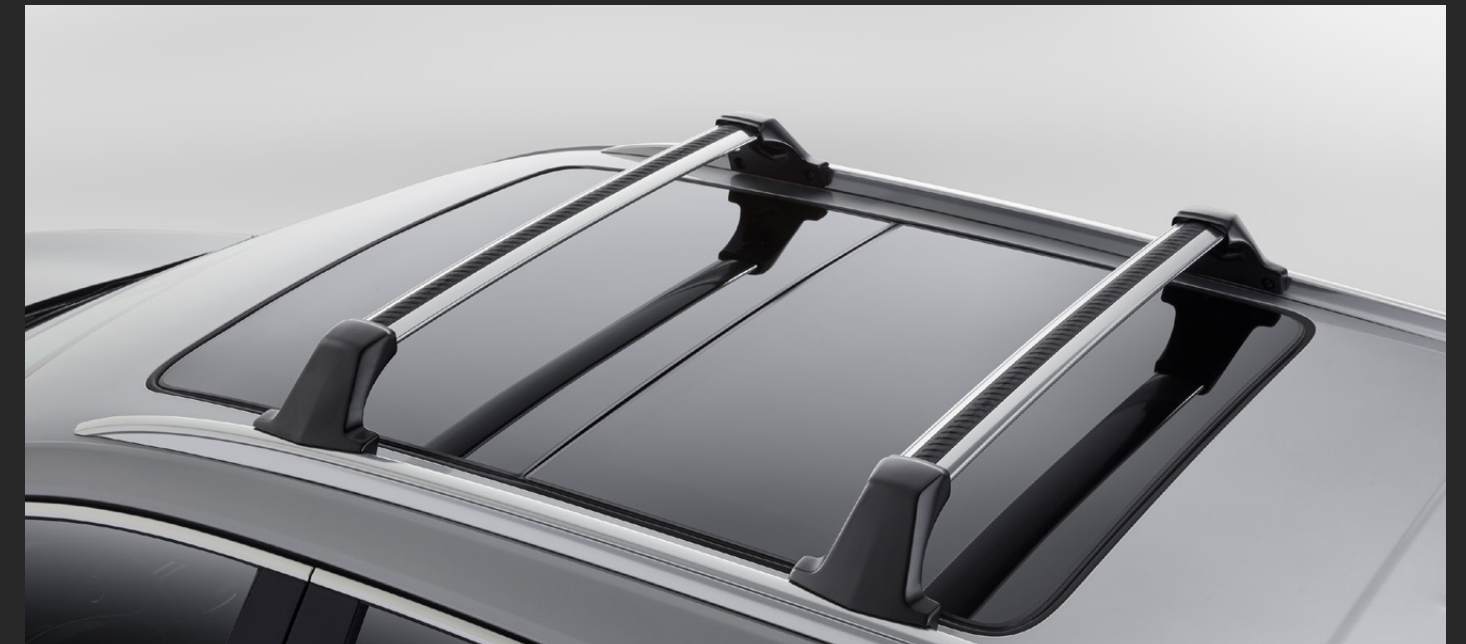
BARRAS TRANSVERSALES DE TECHO