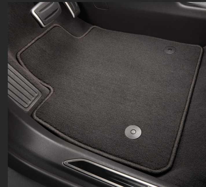
TAPETES DE ALFOMBRA 1ª Y 2ª FILA