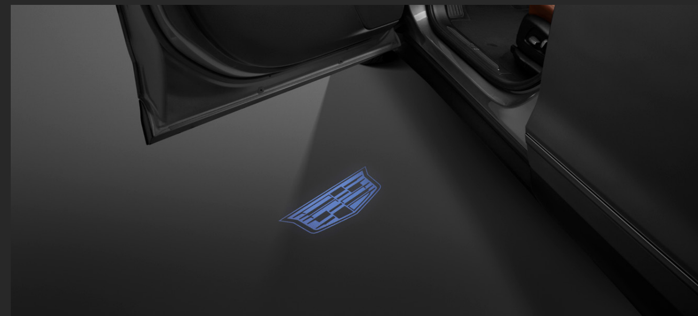
PROYECTOR DE LOGO CADILLAC® PARA PUERTA DELANTERA