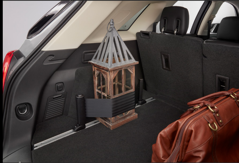
DIVISOR DE CARGA FLEXIBLE EN NEGRO