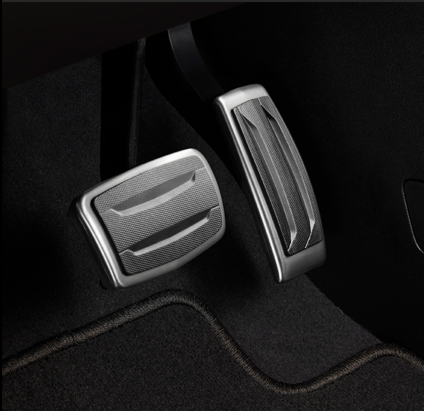
CUBIERTA DE PEDAL EN NEGRO CON ACERO SATINADO