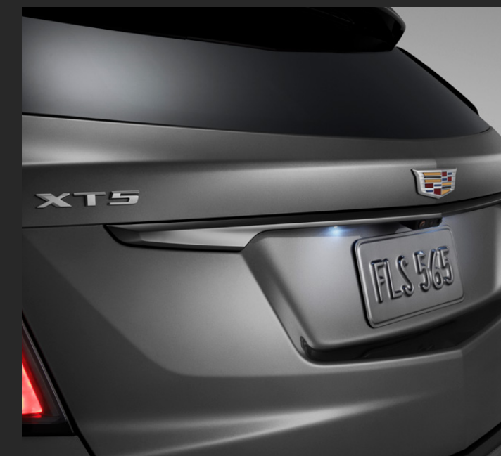
INSERTO DE PUERTA DE CAJUELA