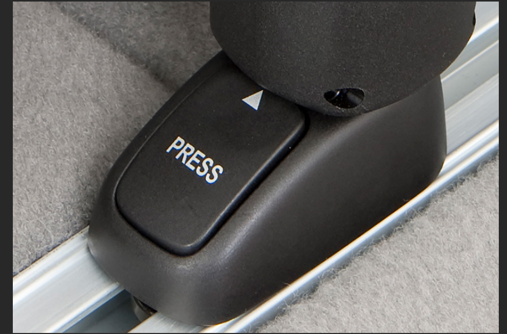
PAQUETE DE DESLIZADORES (2 PIEZAS)