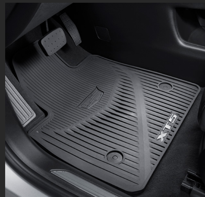
TAPETES DE VINIL 1ª Y 2ª FILA CON LOGO CADILLAC® Y XT5®