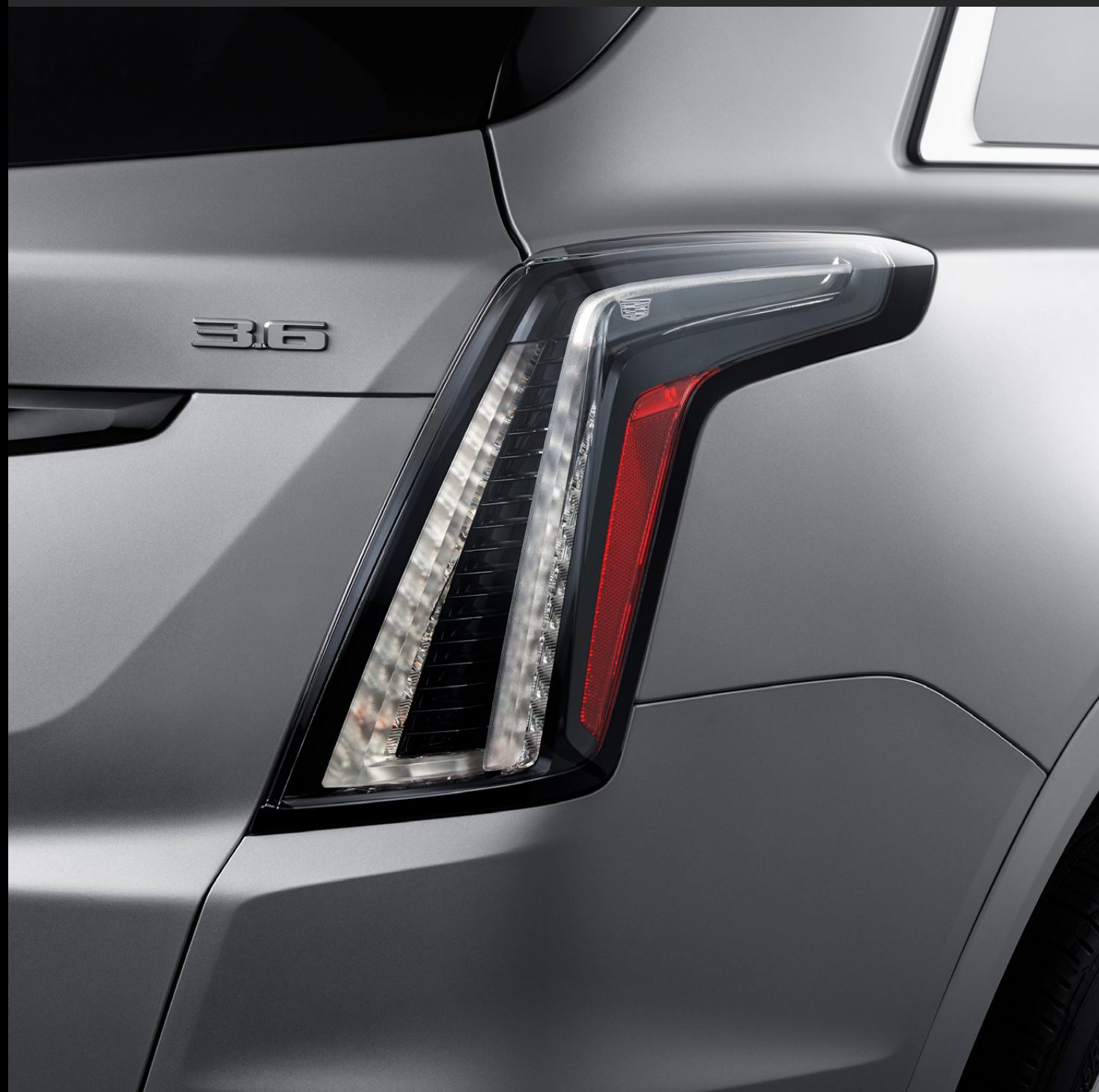
LUCES TRASERAS EN TRANSPARENTE