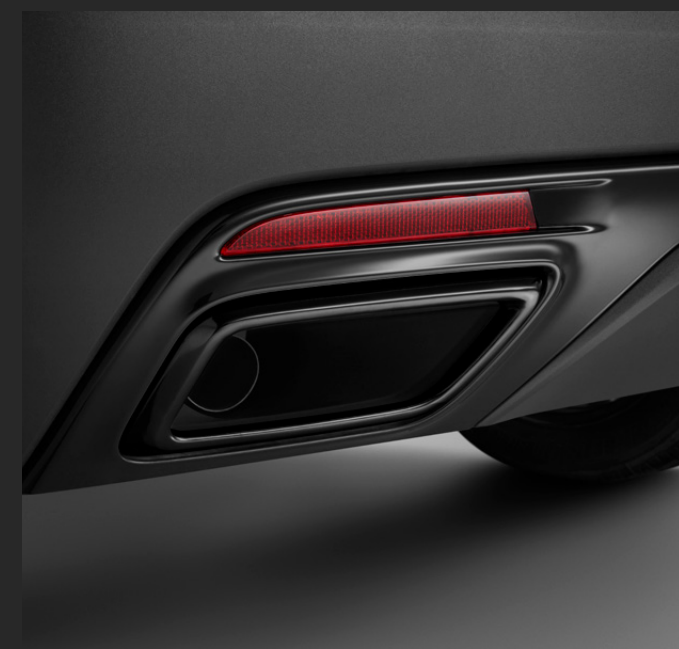
BISEL DE MOLDURAS DE ESCAPE