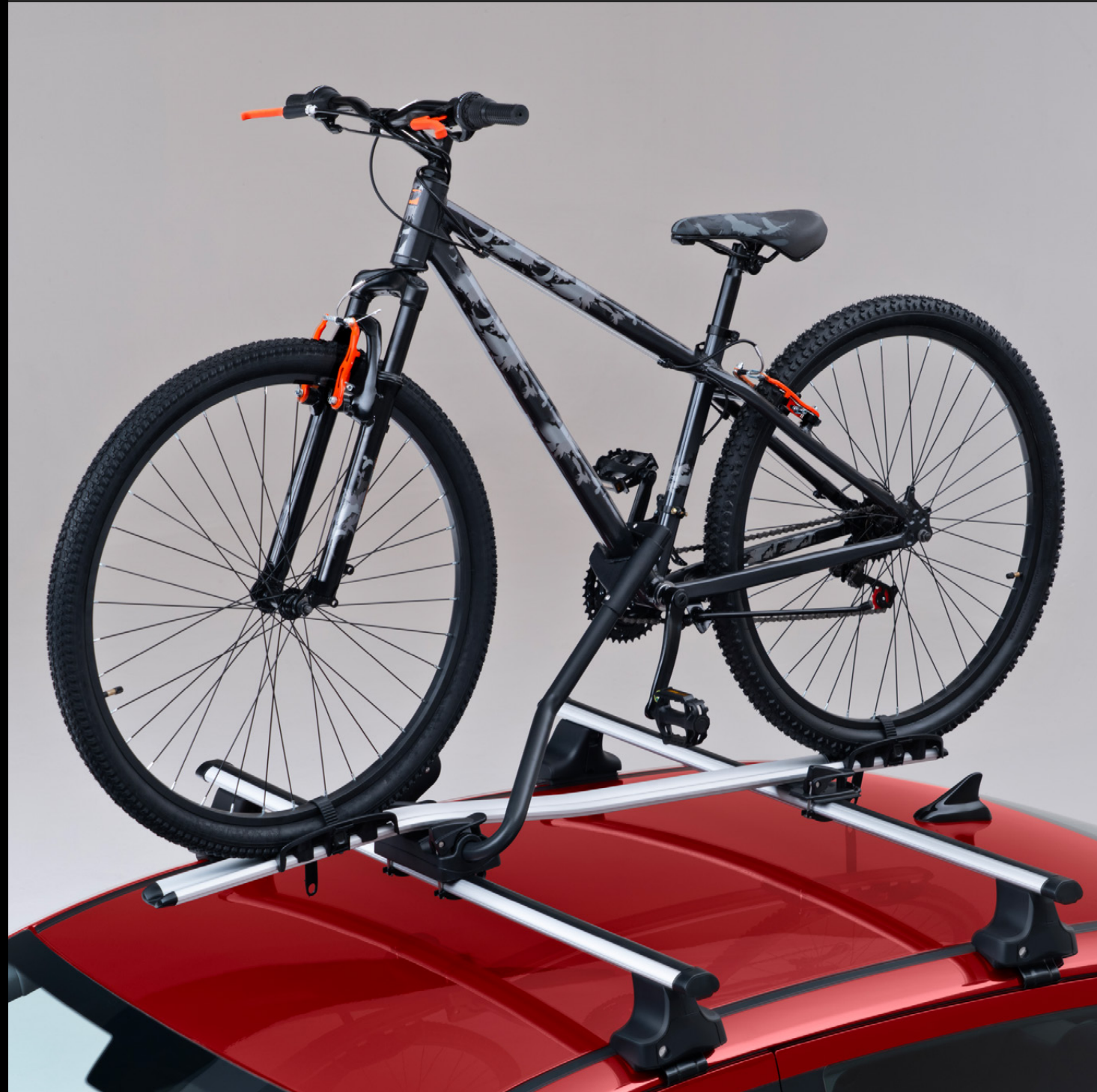
PORTABICICLETAS DE TECHO