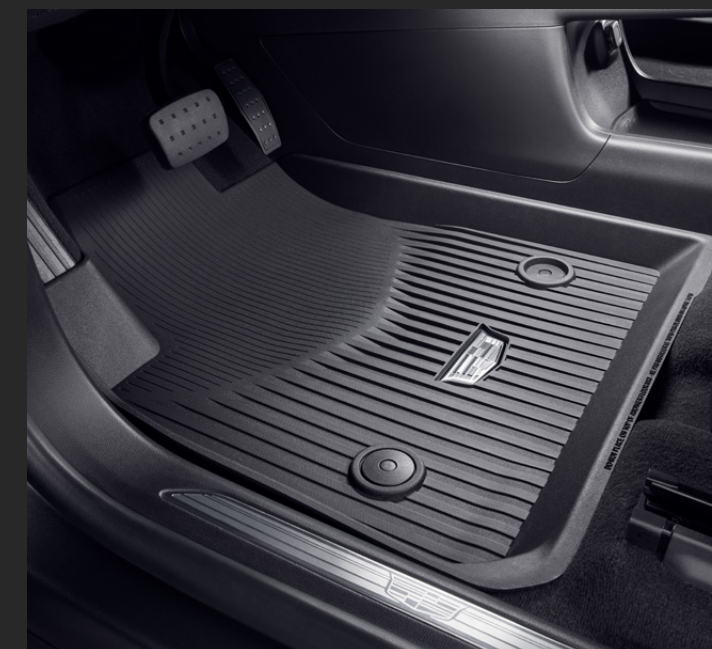
TAPETES DE VINIL RÍGIDO 1ª Y 2ª FILA CON LOGO CADILLAC®