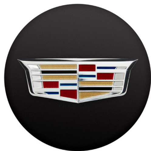
CENTRO DE RIN NEGRO CON LOGO CADILLAC®