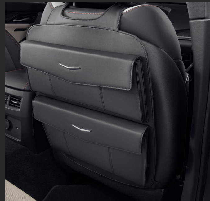
ORGANIZADOR DE ASIENTO