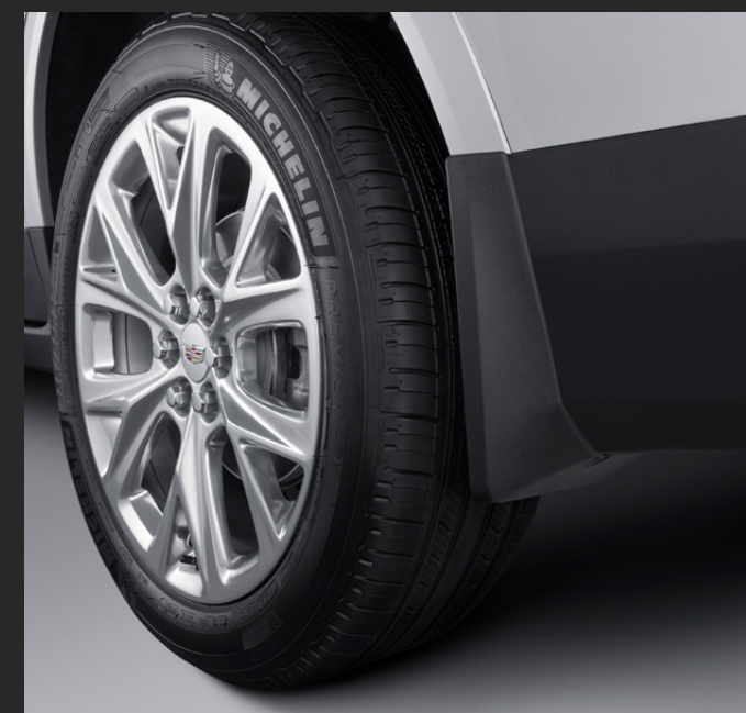
LODERAS MOLDEADAS TRASERAS